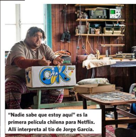
“Nadie sabe que estoy aquí” es la primera película chilena para Netflix. Allí interpreta al tío de Jorge García.

Por estos días, la cara del actor aparece en “La Jauría”, de Amazon; en el regreso de “Soltera otra vez”; hoy, por ejemplo, estrena “Nadie sabe que estoy aquí”. Aquí, revisa los aciertos y fracasos que ha convenzo más de que la tel-