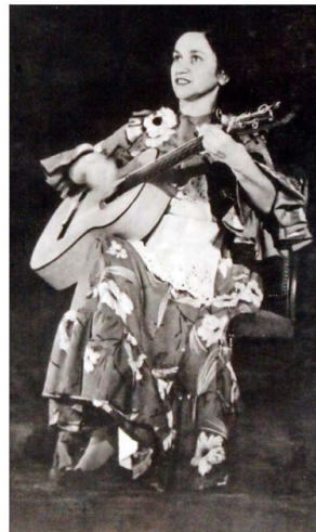
“Esta afinación de la guitarra es la forma como tocan los cantores y cantoras en el campo”, explica sobre la guitarra trapeada.

“El espíritu de esta cueca cambia totalmente porque ya no se refiere al folclor campesino, sino al folclor de los bajos fondos de las ciudades (...). Las palabras de estos cantos hablan de la vida miserable que tienen. Pero siempre en un sentido alegre, no en un sentido llorón como los argentinos”, dice Violeta Parra al público. Gilbert Favre traduce con el adjetivo “sentimental”.