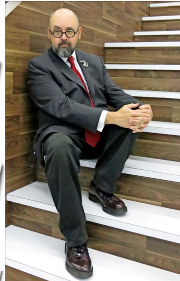
“Mi intención desde el principio era crear un laberinto de historias”, contaba Ruiz Zafón sobre su tetralogía “El cementerio de los libros olvidados”.

guardia cuando el libro llevaba pocos días en circulación. “La sombra del viento” fue el libro más vendido en su país en los años siguientes y traspasó las fronteras hacia Italia, Francia, Holanda, Alemania, Reino Unido, hasta llegar a 50 países y más de 30 idiomas. Mientras en In-