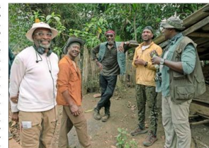
Spike Lee durante la filmación. "Imposible rodar una película sobre Vietnam sin pasar antes por 'Apocalypse Now'", dice.

"Llevo más de veinte años trabajando en proyectos televisivos (Lee ha filmado numerosos stand up , obras de teatro, pilo-