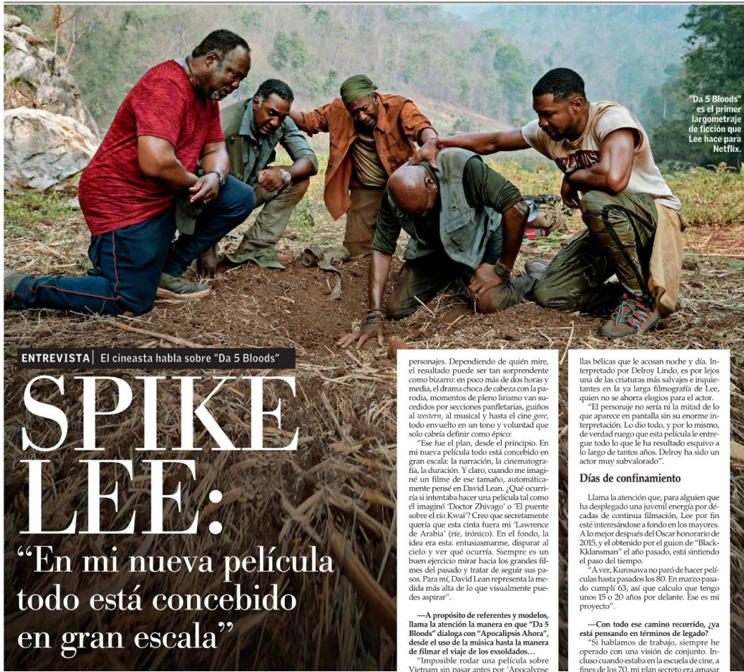
"Da 5 Bloods" es el primer largometraje de ficción que Lee hace para Netflix.

ENTREVISTA | El cineasta habla sobre "Da 5 Bloods"