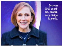
Druyan (70) escribe, produce y dirige la serie.

La creadora de "Cosmos" y viuda de Carl Sagan habla sobre el nuevo ciclo del exitoso programa científico que debuta el martes a las 23:15 horas en Nat Geo.