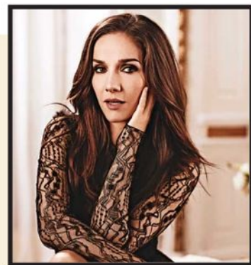
Natalia Oreiro será Eva Perón en la serie que prepara Fox

"Santa Evita", la producción de Fox basada en la novela de Tomás Eloy Martínez, será protagonizada por la cantante y actriz uruguaya Natalia Oreiro en el rol titular, y Darío Grandinetti como Juan Domingo Perón. Además, estará producida por Salma Hayek y codirigida por el colombiano Rodrigo García y el argentino Alejandro Maci, quienes reemplazaron al chileno Pablo Larraín. El estreno en Latinoamérica está programado para el próximo año.