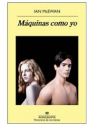
MÁQUINAS COMO YO Ian McEwan Anagrama, Barcelona, 2019, 360 páginas, $18.000. NOVELA

Máquinas como yo padece de extemporalidad. Es curioso, porque a menos que se lea alegóricamente, lo cual sería muy forzado, no encaja con ese sentido profundo de la oportunidad que suelen tener los grandes autores, el cual les permite escribir una narración que da en el blanco de lo que actualmente interpela de manera esencial al lector. En vez de ese sentido de la oportunidad, el lector puede percibir más bien en este caso, por desgracia, oportunismo literario, oportunismo que siempre deviene en no poca banalidad.