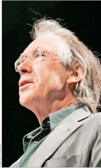
IAN MCEWAN ALDERSHOT, HAMPSHIRE, 1948. Novelista británico. Junto a Julian Barnes y Martin Amis, fue uno de los responsables de renovar la narrativa inglesa contemporánea. Entre sus novelas destacan Niños en el tiempo (1987), Amsterdam (1998) —ganadora del Premio Booker—, Expiación (2001) y Sábado (2005).

El narrador es un joven inglés llamado Charlie que, un poco ya pasado la treintena, permanece en un estado de inmadurez, de semiadolecencia, no ha concluido sus estudios universitarios ni se ha comprometido sentimentalmente y se sostiene económicamente especulando con la compra y venta de activos, desde su departamento a través de internet. El protagonista vive en Londres a fines de los años 70 del siglo pasado, pero ese pasado es ficcionado ligeramente por McEwan, de modo que en él Margaret Thatcher es derrotada en la Guerra de las Malvinas. Ian Turing no se suicida sino que vive para desarrollar grandes avances en la robótica y la inteligencia artificial y su genio permite anticipar desarrollos tecnológicos que en el pasado real surgirán más tarde o todavía no surgen. La tecnología más sorprendente es, sin duda, la fabricación de seres humanos —llamados Adán y Eva, según su género—, cuyo aspecto físico y su manera de comportarse es altamente equivalente a la de un hombre o una mujer de verdad. Charlie,