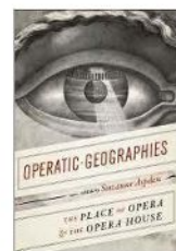
■ SUZANNE ASPDEN (editora) "The place of opera and the Opera House" Operatic Geographies University of Chicago Press, 2019.

3 LA ÓPERA EN LA CIUDAD Poder político, organización social y control de pasiones convergen en la ópera. Es un caso único entre las artes. Desde que nació, en la Camerata del Condi Bardi, la ópera se ha identificado con las negociaciones del poder, en las que estuvieron involucradas las élites, pero también la ciudadanía. Cuando fueron establecidos de manera definitiva los teatros para la ópera, esto se expresó también tanto en la ubicación de los edificios en la ciudad como en su diseño. No ha dejado de ser así: basta pensar en la Ópera de Beijing (2007), sita al oeste del Gran Salón del Pueblo y cerca de la Ciudad Prohibida. Operatic Geographies replantea el paisaje de la ópera como una expresión de territorialidad, con ejemplos que también incluyen espacios menos visibles, como la ópera en las escuelas de niñas en la Inglaterra de finales del siglo XVII, los grupos de ópera en Calcuta del siglo XIX y los teatros rurales franceses de comienzos del siglo XX.