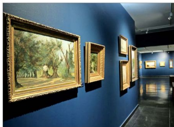
Más de 40 óleos de Swinburn se exhiben en el Centro Cultural El Tranque.

En bienvenidas oportunidades, las exposiciones retrospectivas permiten ejercer la justicia, revalorando artistas poco considerados por la crítica contemporánea. Tal es el caso de Enrique Swinburn (1859-1929) y sus cuarenta y tantos óleos sobre tela reunidos dentro de la flamante arquitectura en negro y blanco del Centro Cultural El Tranque . Considerado alumno, sobre todo de Onofre Jarpa, el pintor homenajeado se muestra de partida como un marinista y paisajista de factura mucho más fina que el maestro. Además, su variado repertorio temático sabe captar la realidad de la época, como certero precisó Romera: "A través de un subjetivismo acorde con sus estados de alma". En general, nos parece que el pintor se desenvuelve mejor mediante los formatos menores y las visiones de ese mar siempre plácido de las bahías. Entre ellas destaca el muy hermoso "Amanecer en el puerto", cuya riqueza de grises halla la variación más acertada entre la luminosidad pareja de la casi plateada superficie acuática y en ciertos sectores más oscuros de nubes, capaces de anunciar tempestad con especial suavidad. Y acá, como complemento perfecto de la