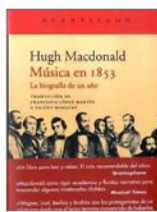
■ HUGH MACDONALD "Música en 1853. La biografía de un año" Traducción: Francisco López Martín y Vicent Minguet. Acantilado, 2019.

4 TRANSFUSIÓN ENTRE GENIOS La corte de Vincenzo Gonzaga de Mantua, paraíso de la poesía, la música y el teatro. En ese escenario, Claudio Monteverdi, el mayor genio musical del siglo XVII italiano, y Pedro Pablo Rubens, un pintor de estilo exuberante, que, como Monteverdi en música, enfatiza el dinamismo, el color, los afectos y la sensualidad. La relación real entre ambos es especulativa, pero Hans Ost la infiere, pues la obra del artista flamenco y el músico cremonés guardan muchas relaciones. Una pregunta que surge de inmediato es cómo antes nadie había reparado en este posible vínculo. El escritor, en un trabajo casi detectivesco, hurga en el ambiente, observa los gustos de la época y cómo los artistas se influían, determinando a la vez el interés estético de la comunidad. Todo esto, en especial a través del análisis de una obra de Rubens: "Consejo de los dioses" (1624, Castillo de Praga), cuyo origen ha sido un misterio para diversas generaciones de historiadores del arte. Uno se pregunta ¿quién va a hacer la película basada en este libro?