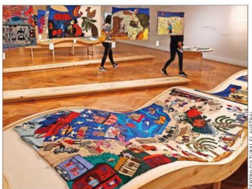
Muestra Bordadoras de Isla Negra llegó al Centro El Austral.