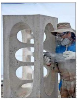
El Simposio Internacional de Esculturas parte el 5 de febrero.

Mientras tanto, el Concurso de Pintura "Valdivia y su río", convocado por el municipio y próximo a cumplir 40 años de vida —el de mayor duración de todo el país—, se prepara para recibir artistas y obras de distintos países, entre el 16 y el 19 de enero. El popular concurso involucra a todos los habitantes y visitantes de la ciudad en su modalidad de pintura in situ . Es usual ver cómo los cientos de participantes se desplazan por la costanera, el mercado fluvial, los edificios patrimoniales, el jardín botánico y otros lugares de la ciudad. Las obras premiadas y seleccionadas se exhibirán luego en la Casa Prochelle.