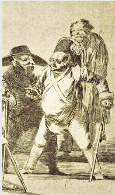
Goya, serie los Caprichos. La mayor muestra de sus dibujos en el Prado.

En marzo, el museo inaugura algo muy distinto. Se trata de la ambiciosa exposición sobre "El papel de la mujer entre 1833-1931" , la que sí se relaciona con otra muestra actual del museo, de dos artistas italianas y pioneras: Sofonisba Anguissola (1535-1625) y Lavinia Fontana (1552-1614). Sofonisba trabajó en el corte de Felipe II y Lavinia fue retratista en Bolonia. La nueva exhibición abordará, ahora, el rol de la mujer en el sistema español del arte en el siglo XIX y en los primeros años del siglo XX. El objetivo es analizar —a través de exposiciones y debates— la imagen femenina en el arte, que el Estado validó con premios y exposiciones en museos, destacando el rol que ocupaba en la sociedad.