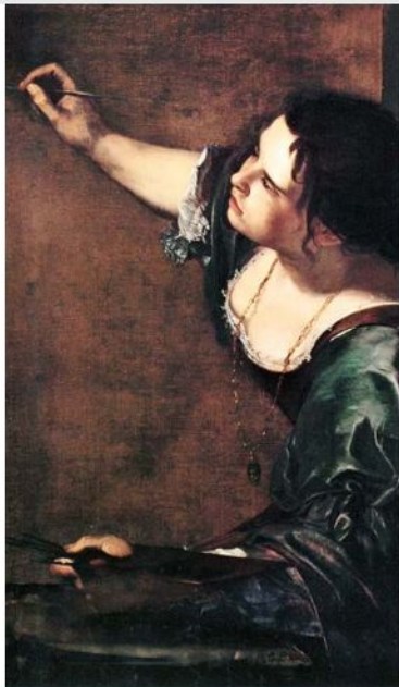
"Autorretrato", de la pionera pintora italiana del Barroco Artemisa Gentileschi.

Una discípula destacada de otro maestro del Barroco, el italiano Caravaggio, será objeto de una nueva muestra de magnitud en la National Gallery, a partir de abril. La elegida es Artemisa Gentileschi , primera mujer en integrar la Accademia delle Arti del Disegno en Florencia. Se reunirán 40 piezas que incluyen su trayectoria en Florencia, Roma, Londres. Termina con su obras de Nápoles, donde dirigió un exitoso estudio. Entre las pinturas que el museo destaca están "Autorretrato como ejecutante de laúd", 1615-18; y la reciente adquisición, "Autorretrato como santa Catalina de Alejandría".