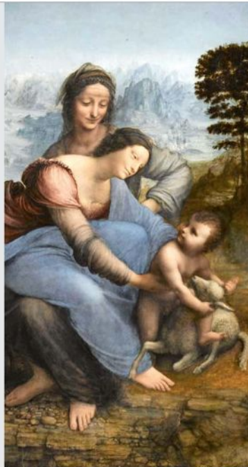
Leonardo da Vinci: "Santa Ana, la Virgen y el Niño", del Museo del Louvre.