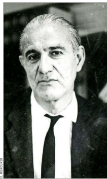
CARLOS DROGUETT SANTIAGO, 1912-BERNA, 1996. Novelista y cuentista chileno. Es autor de las novelas Setenta muertos en la escalera (1939), Eley (1960) y Patas de perro (1965), entre otras. Recibió el Premio Nacional de Literatura en 1970. En 1975 fijó su residencia en Suiza y no regresó a Chile.

La complejidad, el riesgo, la densidad de los elementos y significados que mueven a El compadre explican la vigencia de esta obra, que impresiona por su frescura y, a la vez, por la multiplicidad de planos que el autor logra enhebrar en torno a una historia simple, que se hace compleja y rica por la manera en que es narrada. Su protagonista es Ramón Neira, un obrero de la construcción, alcohólico, que vive en el Zanjón de la Aguada, junto a su "mama" y su hijo Pedro, de ocho años. La anécdota es que Ramón, a cambio de abandonar el vino, le pide a San Justas Tadeo que apadrine a su hijo que no ha sido todavía