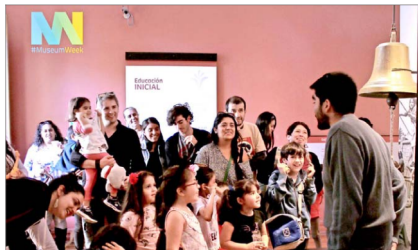
El Museo de la Educación Gabriela Mistral participará por segunda vez en este evento.