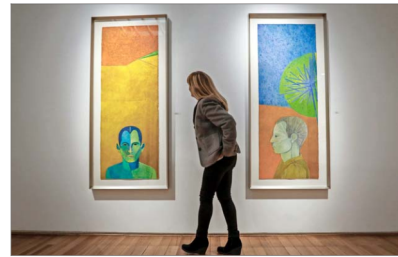
Los personajes en la obra de Benjamín Lira que se exhibe en Galería Tomás Andreu ostentan contornos afilados y una composición casi escultórica.