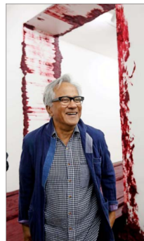
Un sonriente Anish Kapoor (1954), en Santiago, junto a parte de su monumental obra "Svayambhu", en sánscrito, que significa auto-creado.

La muestra, en tanto, se inicia en las salas subterráneas con una escultura con espejos especiales que interactúan con el espectador. Recuerda su famosa obra "Cloud Gate", emplazada en Chicago y que refleja a las personas y el entorno. Pero es su monumental trabajo con un rotundo bloque de cera roja, con el título en sánscrito "Svayambhu" (2007), lo que impacta más. Se mueve casi imperceptible y los supuestos rieles que se dibujan parecen conducir a esa gran puerta roja que evoca, según algunos, la muerte o la entrada a un campo de concentración, citando los orígenes judíos de él.