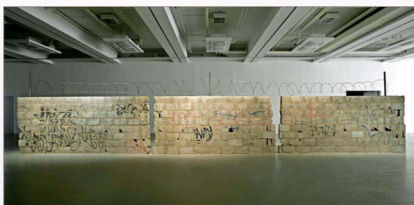
La provocadora y polémica artista mexicana Teresa Margolles promete una vez más remecer con sus muros que evocan la violencia del narcotráfico y las muertes. Muro de Tijuana.