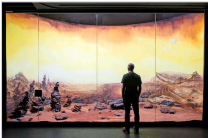
Sus obras de Dominique Gonzalez-Foerster atraviesan el cine y la poesía, como este Diorama sobre Marte.