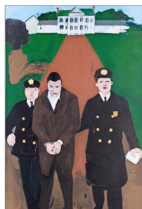
Henry Taylor, pintor estadounidense, aborda hechos de injusticia en su país.

bla de la violencia de su país donde los agujeros metafóricamente a los muertos; aunque el artista no debiera dejar fuera una alusión al “muro de Trump” y lo que ello conlleva.