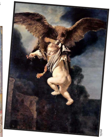
Rembrandt. “El rapto de Ganimedes”, obra de 1635.