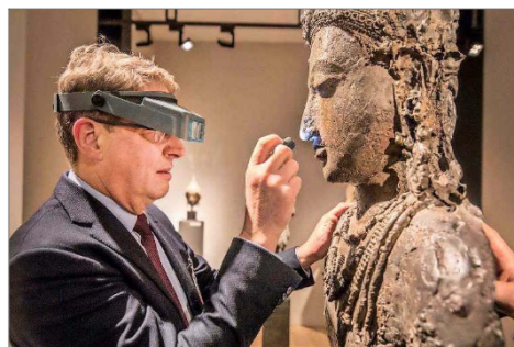
Solo directores y curadores de museos, además de expertos independientes, integrarán los comités de Tefaf.