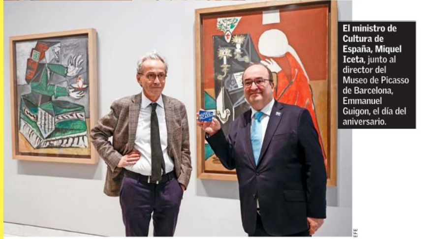
El ministro de Cultura de España, Miquel Iceta, junto al director del Museo de Picasso de Barcelona, Emmanuel Guigón, el día del aniversario.

Benjamín Lira: "Abrió las puertas para el arte multidisciplinario de hoy"