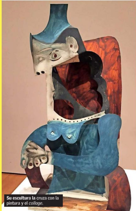
Su escultura la cruza con la pintura y el collage.