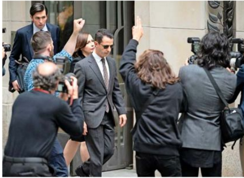
El actor Jeremy Strong ganó un Emmy como Mejor Actor de serie dramática por su interpretación de Kendall Roy.

“Para mí la TV es el más poderoso de los medios dramáticos, más poderoso que el cine; el cine está pasado de moda, se perdió a sí mismo. La TV es mucho más libre”, opina.