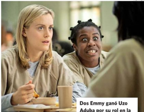
Dos Emmy ganó Uzo Aduba por su rol en la serie “Orange is the New Black”.

“Espero que podamos empezar conversaciones sobre temas que tocamos, como el privilegio del hombre blanco, la injusticia racial, cómo es ser una mujer de color en el mundo, la diferencia de clases”, dice la productora ejecutiva.