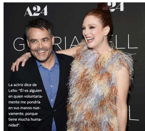
La actriz dice de Lelio: "Él es alguien en quien voluntariamente me pondría en sus manos nuevamente, porque tiene mucha humanidad".

inmediato, le dije: "Los Angeles", porque siento que debe ser una gran ciudad en la que esté conduciendo un automóvil todo el tiempo; es probable que sus hijos (de Gloria) vivan en la ciudad, pero puedan estar lejos. Puedes estar rodeado de gente, pero estar solo. Todas esas cosas. Lo mismo con la música. Todas las canciones de la película original eran de amor, muy familiares para personas en América del Sur, pero (en esta) necesitamos canciones en inglés que, en primer lugar, pudiéramos pagar. Las canciones son caras de usar en una película, pero también pueden hablarles a todos. Esos hermosos temas de amor que disfrutamos de tanto escucharlos y cuyas letras conocemos bien. Escogimos las canciones con mucho cuidado y la respuesta a ellas, incluso en el set, fue que todos empezaron a cantarlas, porque son las canciones que todos amamos.